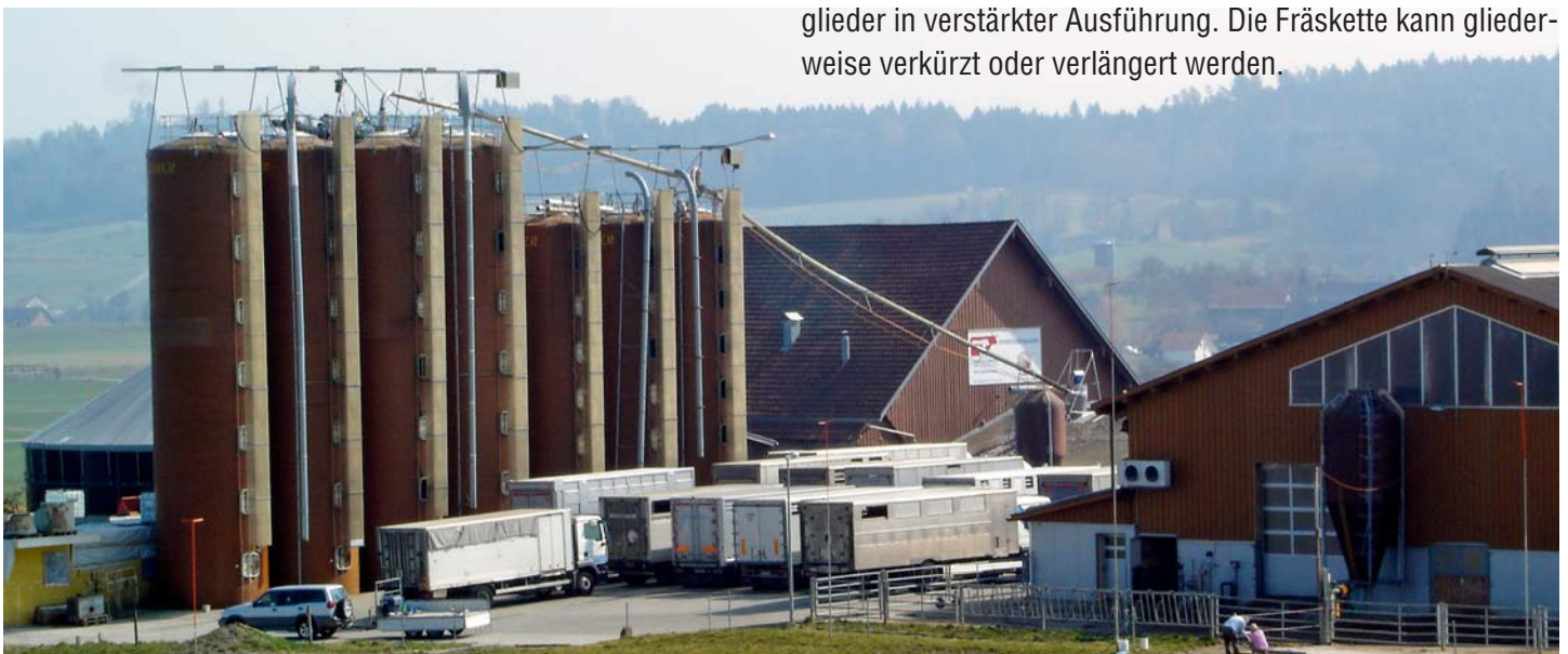
Gewaltige Saugleitungen bis zu 70 m sind mit dem neuen Edelstahl-Turbo-Zyklon erreichbar.