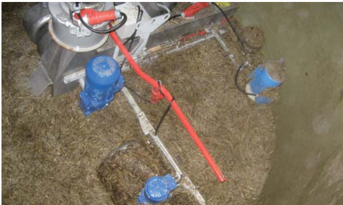
Für den extremen Winterbetrieb gibt es auf Sonderwunsch einen mit Elektromotor angetriebenen Eisfräser, der nachgezogen wird.

Die MUS-MAX Komet-Silofräse überzeugt durch eine gleichmäßige und sehr hohe Entnahmeleistung. Durch ihre einfache, wirkungsvolle Konstruktion wird sie den Anforderungen der modernen Siliertechnik optimal gerecht. Sie ist auch im Wintereinsatz bei besonders tiefen Temperaturen funktionssicher. Das Grundgerät ist ohne Werkzeug (mit Stecksplinte) im Baukastensystem zerlegbar. Der Aus- und Einbau ist in wenigen Minuten auch bei einer Luke 60 x 80 cm möglich. Es sind Typen für Silodurchmesser von 2,50 bis 7,00 m lieferbar.