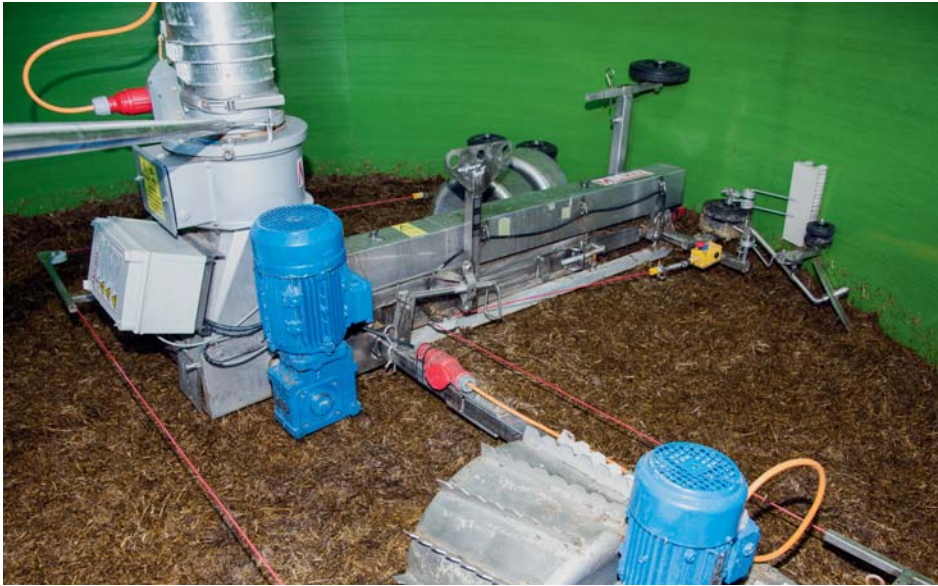
Exakte Wandreinigung durch Scheibensech und gezogener Bürste.

Die MUS-MAX Komet-Silofräse überzeugt durch eine gleichmäßige und sehr hohe Entnahmeleistung. Durch ihre einfache, wirkungsvolle Konstruktion wird sie den Anforderungen der modernen Siliertechnik optimal gerecht. Sie ist auch im Wintereinsatz bei besonders tiefen Temperaturen funktionssicher. Das Grundgerät ist ohne Werkzeug (mit Stecksplinte) im Baukastensystem zerlegbar. Der Aus- und Einbau ist in wenigen Minuten auch bei einer Luke 60 x 80 cm möglich. Es sind Typen für Silodurchmesser von 2,50 bis 7,00 m lieferbar.