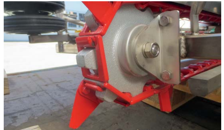
Speziell für Grassilage wurden eigene Messerklingen entwickelt. Diese Messerklingen haben auf der Stirnseite eine scharfe Schneide. Die Fräskette hat speziell gehärtete Einzelglieder in verstärkter Ausführung. Die Fräskette kann gliederweise verkürzt oder verlängert werden.