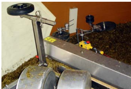
Planregler-Tastrad an der Silowand hält Fräse immer waagrecht.